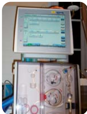
Modèle « 5008 » du laboratoire Fresenius