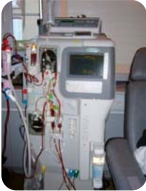
Modèle « Integra » du laboratoire Hospital