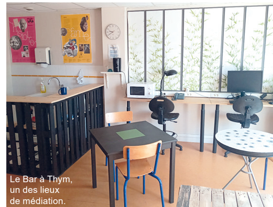
Le Bar à Thym, un des lieux de médiation.